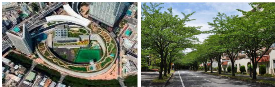
立体都市公園の整備