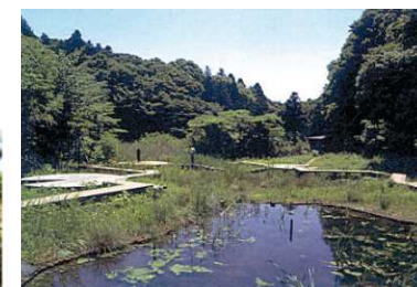
都市に残された緑地の保全