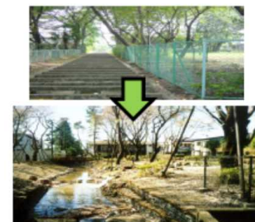
河川と公園との一体的な再整備