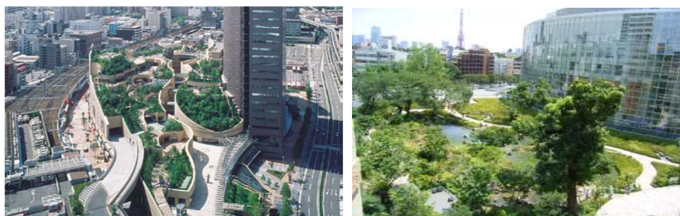
民間建築物等の敷地内緑化